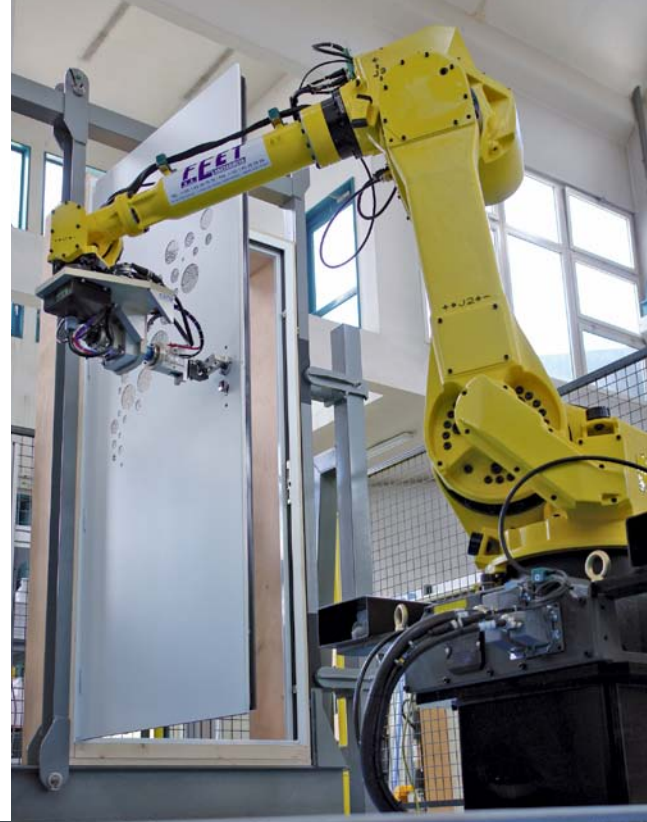
Tests de résistance, d'endurance mécanique et de manoeuvrabilité dans les laboratoires du CSTB de Marne-la-Vallée.