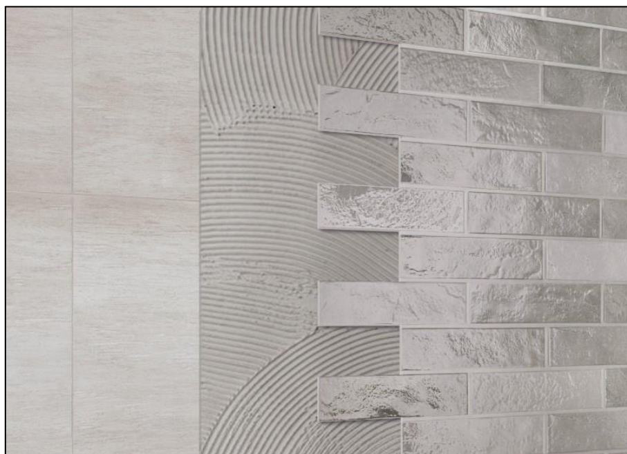
b) Décalage jusqu'à 50% de la longueur de pièces