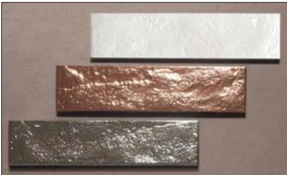
Figure 2 : Exemple de carreaux Brick Generation