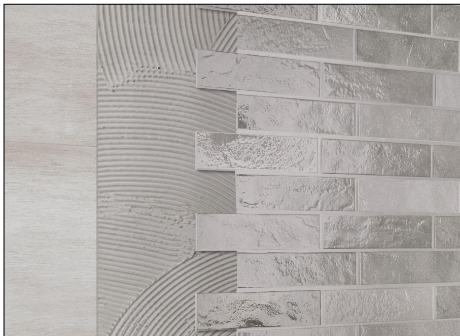
a) Décalage pour 1/3 de la longueur de pièces